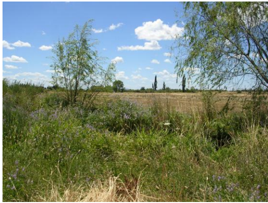
Ökologische Ausgleichsfläche in Chile