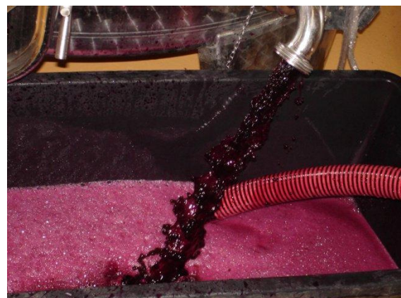
Wein wird gelüftet, was den Böckser verhindert

Dumpfe, gemüsig-zwiebelhafte Noten, oder Düfte die an faule Eier erinnern, deuten auf Böckser hin. Mit ausreichender Stickstoffversorgung der Hefe während der Gärung und mit einem moderaten sauerstoffreichen Weinausbau kann dieser Fehler meist verhindert werden. Diesen Weinfehler trifft man bei Weiss- und Rotweinen an.